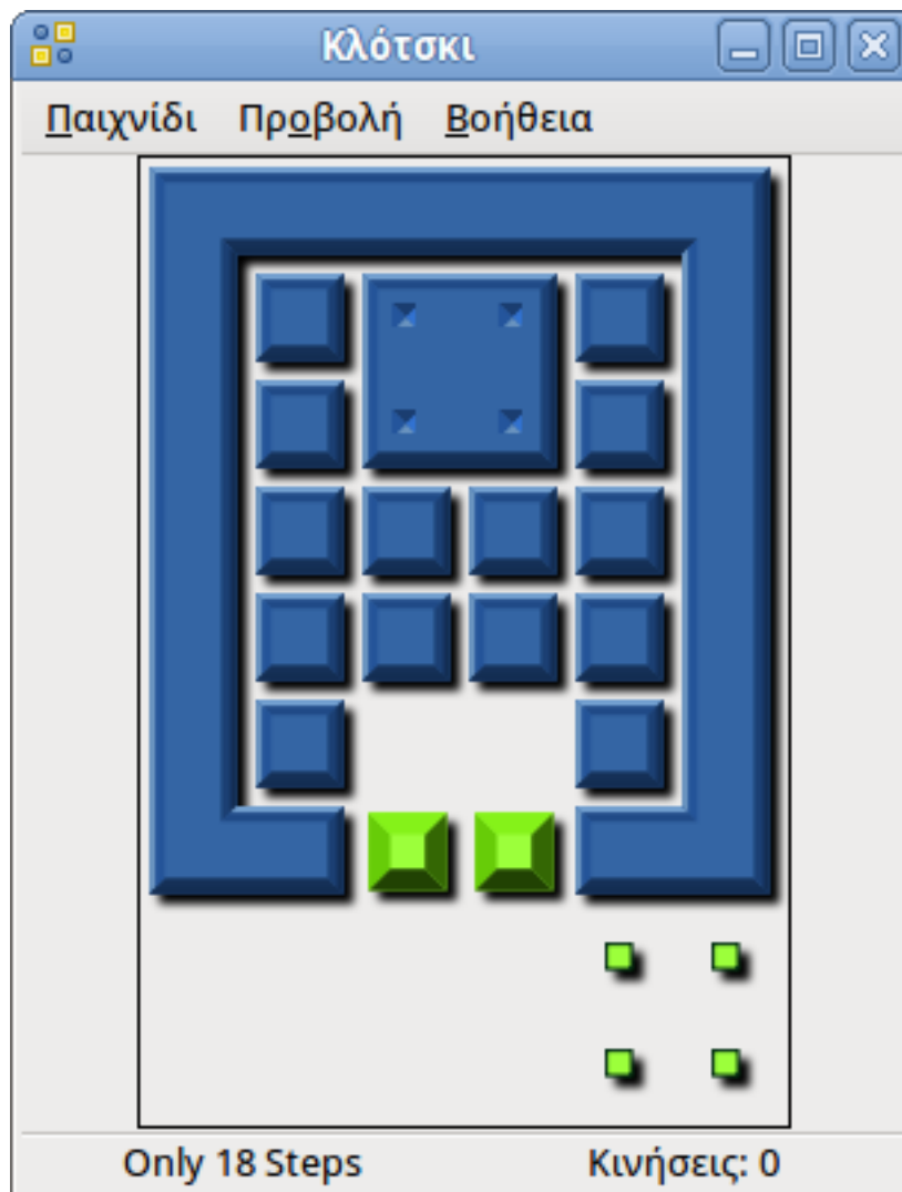
Figure 2: Το παράθυρο εκκίνησης Κλότσκι

Όταν εκκινείτε το Κλότσκι, το ακόλουθο παράθυρο εμφανίζεται.